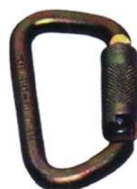
Mosquetón N268G Acero 50 Kn Yoke Doble cierre y triple cierre