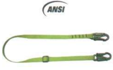
Eslinga Doble Mosquetón Regulable Reata