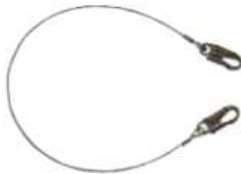
Eslinga en Acero