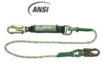
Eslinga Amortiguador en cuerda