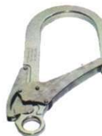
Mosquetón N501110 Estructurero Grande Duraluminio Yoke