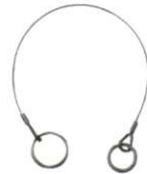
Anclaje en Acero