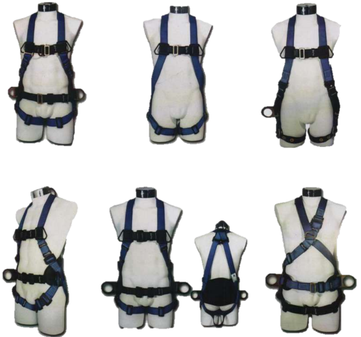
Arnés diferentes tipos Marca Alto- Hawk