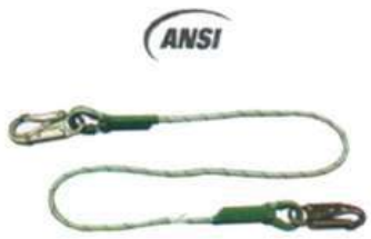
Eslinga doble Mosquetón en cuerda