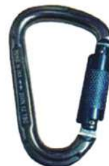
Mosquetón N283 Aluminio 23 Kn Yoke