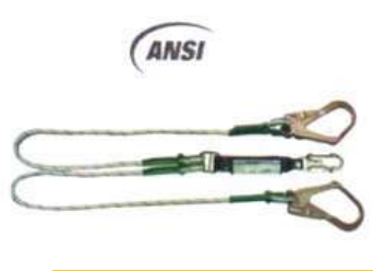
Eslinga en Y Amortiguador en cuerda