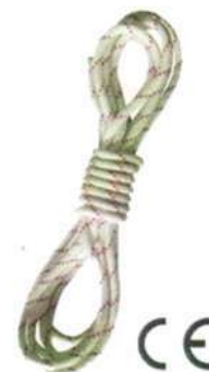
Cordino 8 mm