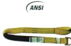
Anclaje portátil en reata 1 m y 1.80 m