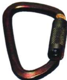
Mosquetón N248G Acero 50 Kn Gran Apertura Yoke