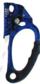
Ascendedor PILOT (Der)