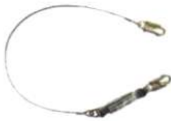
Eslinga en Acero con Amortiguador