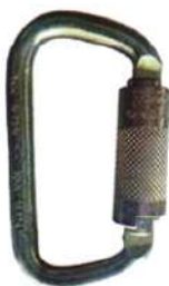
Mosquetón N-251G 30Kn Yoke