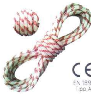
Cuerda Estática 13 mm