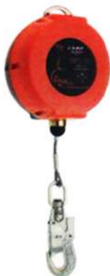
Eslinga Retráctil COBRA