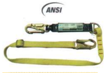
Eslinga Amortiguador en Reata Regulable