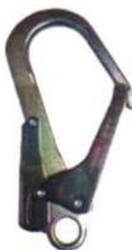
Mosquetón N314 Estructurero en acero yellow Zinc Yoke