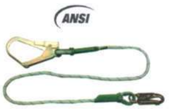
Eslinga Posicionamiento Gancho Mixto, cuerda