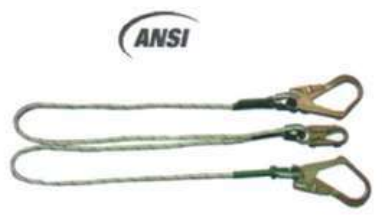
Eslinga de Posicionamiento en Y - cuerda