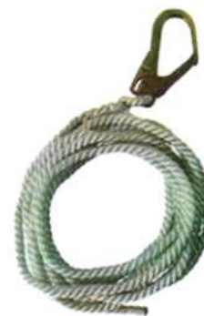
Línea de Vida Cuerda Trenzada de 10 m a 50 m Safe Step