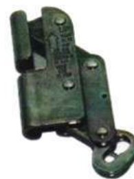
Frenos N621 y N623 para cable Yoke