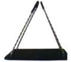
Arnés tipo silla Madera y Plástico Ref. -160006-1