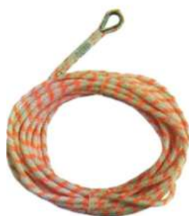
Línea de vida con ojo 11 mm y 13 mm 10 m a 200 m