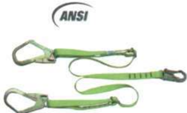
Eslinga en Y Regulable Reata