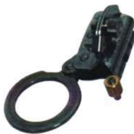
Frenos en Acero para Cuerda Yoke