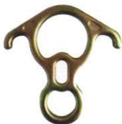
Descendedor N4506 Ocho en Acero Yoke