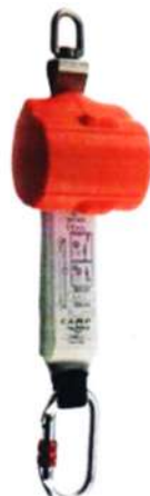
Eslinga Retráctil COBRA