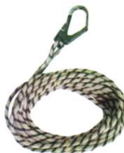
Línea de vida con mosquetón 11 mm, 13 mm y 16 mm 10 m a 200 m