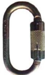
Mosquetón N-244G 25Kn Yoke