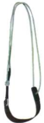
Pretal para Ascenso a postes, Par