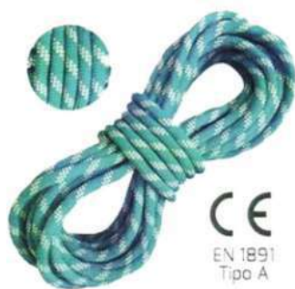
Cuerda Estática 11mm y 13mm