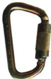
Mosquetón N252G Acero 41 Kn Yoke